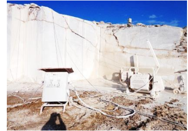
الف- پارگی سیم برش الماسه (معدن داش‌آغول ۳)