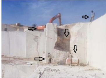
ب- سهل‌انگاری پرسنل در نزدیکی پله (معدن داش‌آغول شماره ۲)