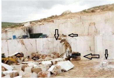
ج- احتمال برخورد با ماشین‌آلات و خواباندن بلوک (معدن داش‌آغول ۳)

فعال‌های حوزه معدن و سنگ ساختمانی تهیه شده است. برخی از مهم‌ترین خطرهای محتمل در معادن مورد مطالعه در