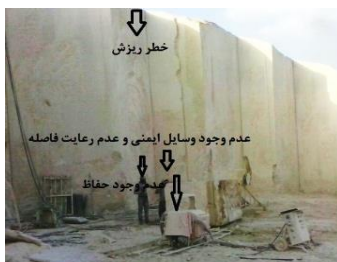
ط- قواره کردن بلوک (معدن مرمریت داش‌آغول ۳)