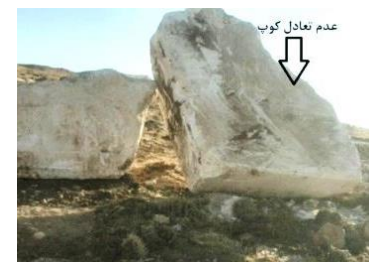
ز- احتمال واژگونی کوب (معدن مرمریت ناری ارومیه)

شکل ۲- برخی مخاطرات محتمل معمول در معادن مورد مطالعه