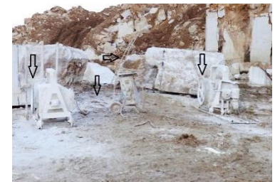
د- لغزش پرسنل در سطوح لغزنده (معدن مرمریت ناری ارومیه)