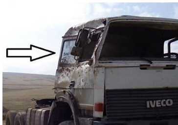
و- حوادث جاده‌ای واژگونی تریلی در مسیر (معدن مرمریت داش‌آغول شماره ۳ ارومیه)