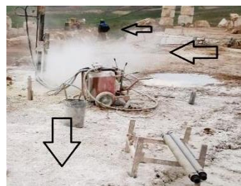
ح- گرد و غبار (معدن مرمریت داش‌آغول شماره ۲)