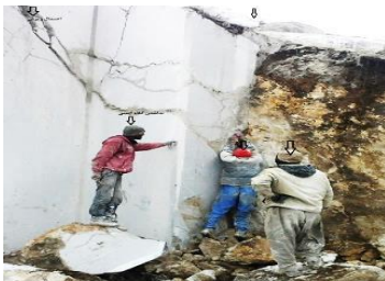
ه- ریزش قطعه سنگ و قرارگیری نامناسب پرسنل (معدن دیزج ارومیه)